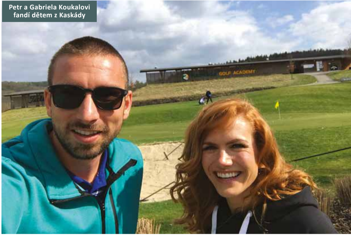
Petr a Gabriela Koukalovi fandí dětem z Kaskády

Manželé Gabriela a Petr Koukalovi se díky jejich sportovnímu nasazení, píli a odhodlání vyhoupli až do těch nejvyšších příček celosvětových žebříčků. Petr v badmintonu a Gabriela v biatlonu. A není to tak dávno, kdy se spojili ve svazek manželský.