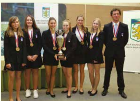
Vítězky 5. ročníku EOHT přijely ze Slovinska

Celkově zvítězil tým dívek ze Slovinska a chlapců z Německa. ■