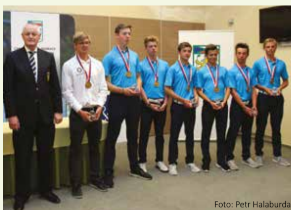
Vítězové v kategorii chlapců do 16 let jsou z Německa.